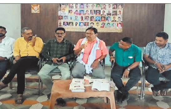
प्रकारों से चर्चा करते जानकारी देते आयोजक।