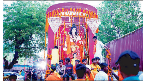
श्री राम प्रभु की शोभा यात्रा निकालते श्रद्धालु।

प्रभु श्रीराम के जन्मोत्सव के अवसर पर 25 मार्च को नगर में भव्य एवं दिव्य रामनवमी शोभायात्रा का आयोजन बड़े उत्साह एवं श्रद्धा के साथ किया गया। शोभायात्रा का शुभारंभ श्री राम मंदिर चण्डीपारा से हुआ, जो नगर के विभिन्न मार्गों से