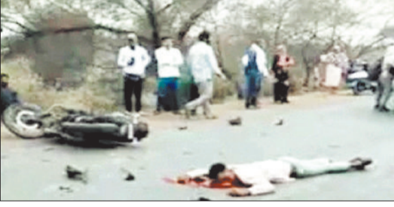
हादसे के बाद सड़क पर पड़ी बाइक तथा युवक की लाश।