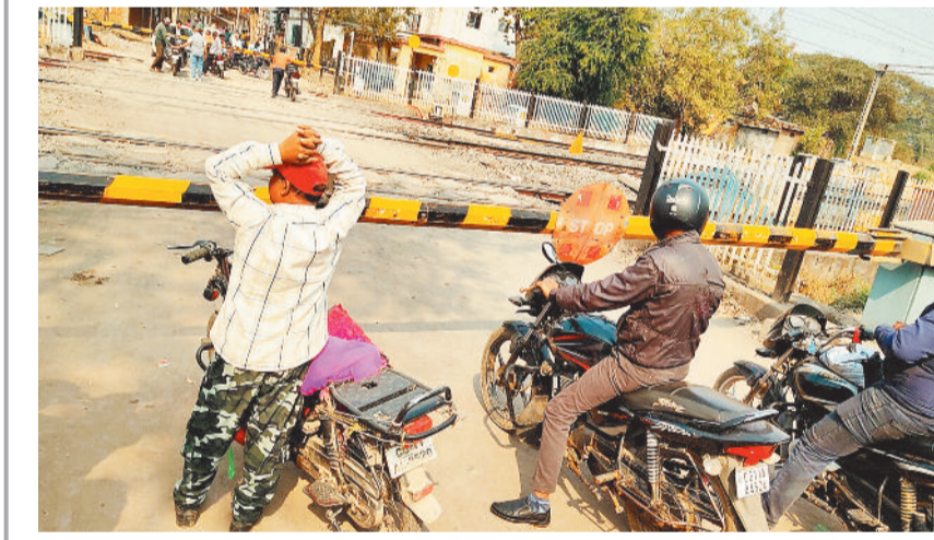
जांजगीर-चांपा। नैला रेलवे फाटक पर ओवरब्रिज की मांग लंबे समय से की जा रही है। कई आंदोलन भी इसके लिए हो चुके हैं। फाटक बंद होने पर लंबे समय तक लोग जाम में फंसते हैं। अब गर्मी के मौसम में बंद फाटक को पार करने लोगों को पसीना बहाना मजबूरी हो गई है।