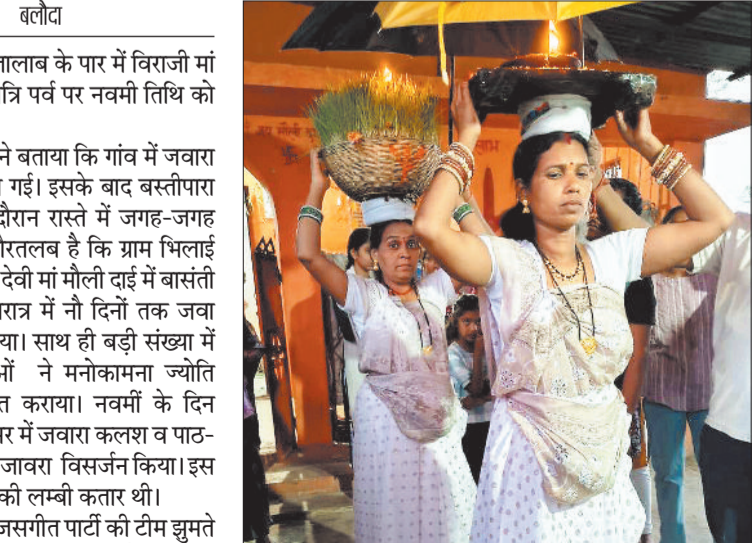
जवारा विसर्जन करने जाती महिलाएं।