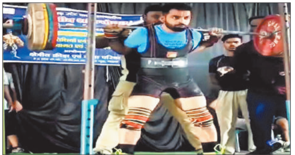
कला का प्रदर्शन करते पावर लिफ्टर