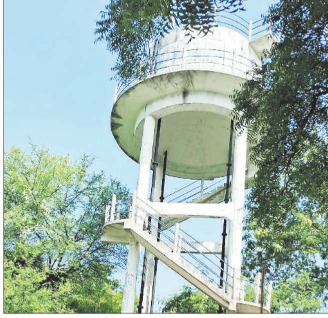
बहाराडीह की सूखी पानी टंकी।

जांजगीर चांपा जिले में जल जीवन मिशन का बुरा हाल है। यहां 4 साल बाद भी टंकी से पानी की सप्लाई ठीक नहीं हो सकी है। स्थिति यह है कि सवा चार सौ गांवों में से ले देकर 83 गांव में पानी सप्लाई का दावा किया जा रहा है, जबकि बाकी के 75 फ्रीसदी गांव में योजना आधी अधूरी है। गर्मी बढ़ने के साथ ही ग्रामीण क्षेत्र में पेयजल की समस्या बढ़ने लगी है। जिले में 424 गांव में जल जीवन मिशन योजना अंतर्गत टंकी बनाकर हर घर पानी सप्लाई करने की योजना 4 साल पहले प्रारंभ की गई थी, लेकिन योजना का काम अब तक पूरा नहीं हो सका है। विभागीय सूत्रों के मुताबिक जिले की 83 गांव में जल जीवन मिशन के अंतर्गत पानी सप्लाई जैसे तैसे हो रही है, जबकि बाकी के गांव में इस योजना का काम पूरा नहीं हो सका है। कहीं पाइपलाइन का काम अधूरा है तो कहीं पाइपलाइन बिछाने और टंकी निर्माण करने के बाद जल स्रोत नहीं मिल रहा है। ऐसे में टंकी शो पीस बनकर रह गई है और ग्रामीणों को पेय जल के लिए हलाकाम होना पड़ रहा है। बलौदा ब्लाक के ग्राम पंचायत जाटा में इस योजना के तहत बनी टंकी से महज तीन दिन ही घरों में पानी पहुंचा। इसके बाद ऐसी खराबी आई कि आज तक पानी सप्लाई नहीं हो रही है। इसी प्रकार बहाराडीह में टंकी निर्माण करके पाइपलाइन बिछा दी गई है, लेकिन जल स्रोत नहीं मिल रहा है। यहां