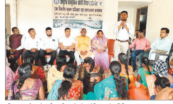
प्रशिक्षण कार्यक्रम में उपस्थित किसानों को संबोधित करते अतिथि।

राष्ट्रीय प्राकृतिक खेती मिशन, देश में खेती को रासायन मुक्त, टिकाऊ और लाभकारी बनाने की दिशा में एक बड़ा कदम है। यह मिशन न केवल किसानों की आय बढ़ाने में मदद करेगा, बल्कि पर्यावरण और स्वास्थ्य के लिए भी बहुत महत्वपूर्ण है।