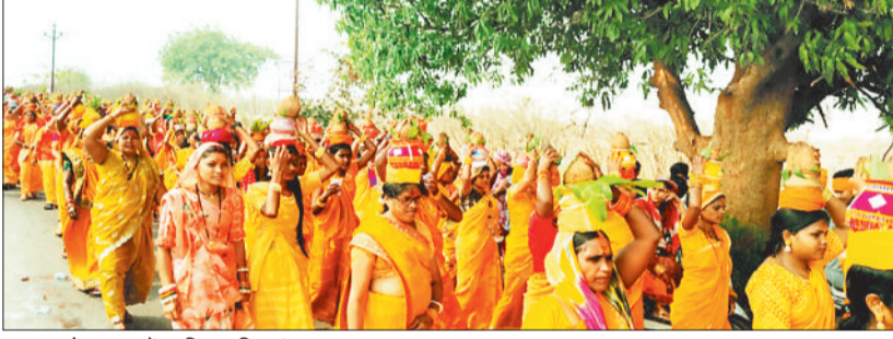
कलश शोभायात्रा में शामिल महिलाएं।

पीले वस्त्रों में सुसज्जित महिलाओं ने सिर पर पवित्र कलश धारण कर जैसे ही यात्रा प्रारंभ की, पूरा ढपढप क्षेत्र जय श्री राम, बोलो पवनपुत्र हनुमान की जय और जय बजरंगबली के गगनभेदी जयकारों से गूंज उठा। श्रद्धा और अनुशासन के साथ आगे बढ़ती इस विराट यात्रा ने हर किसी के मन में भक्ति का संचार कर दिया। ऐसा प्रतीत हो रहा था मानो पूरा क्षेत्र किसी दिव्य आध्यात्मिक महोत्सव का साक्षी बन गया हो। कलश यात्रा केवल एक धार्मिक परंपरा भर नहीं रही, बल्कि यह आस्था, नारी शक्ति, सामाजिक समरसता और सनातन संस्कृति के गौरव का भी भव्य प्रतीक बनकर उभरी। हजारों महिलाओं की एक साथ उपस्थिति ने यह संदेश दिया कि जब समाज की मातृशक्ति धर्म और संस्कृति