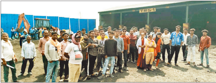
धरना प्रदर्शन करते भूविस्थापित।

एसईसीएल गेवरा परियोजना के प्रभावित ग्राम नरईबोध और गेवरा क्षेत्र के ग्रामीणों ने अपनी पुनर्वास, मुआवजा, बसाहट और वैकल्पिक रोजगार सहित अन्य लंबित मांगों को लेकर गेवरा खदान और आउटसोर्सिंग कंपनी पीएनसी कार्यालय के समक्ष धरना प्रदर्शन शुरू कर दिया। भूविस्थापितों के आंदोलन से पीएनसी कार्यालय में कामकाज ठप पड़ गया। इस दौरान परियोजना का कार्य लगभग 4 घंटे तक बाधित रहा। हालांकि चर्चा के बाद पीएनसी कंपनी में 13