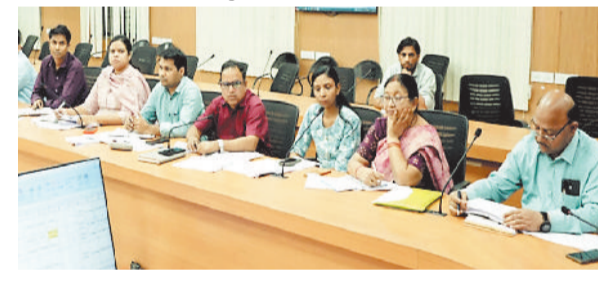
हरिभूमि न्यूज ►► कोरबा